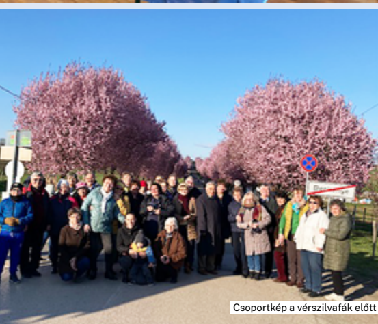
Csoportkép a vérszilvák előtt