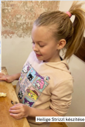
Heilige Strizl készítése