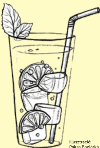
Illusztráció: Paksa Boglárka