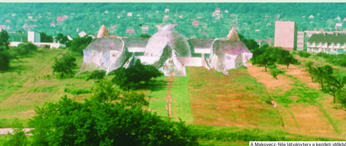
A Makovecz-féle látványterv a kezdeti időkben

Solymár, Hősök utca 65. szám alatt Június 28–29-én 9:00–18:00